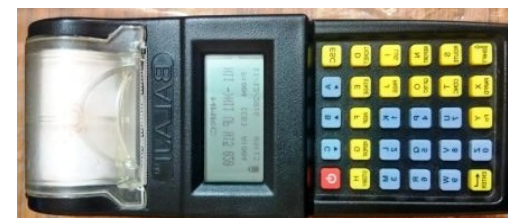
Electronic Ticketing Machine