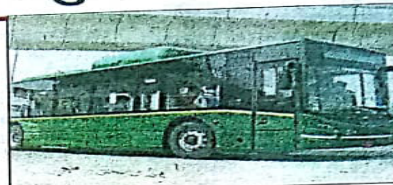
मेट्रो के समय की जानकारी

• जीपीएस से लेस बसें, डिजिटल टिकट की सुविधा