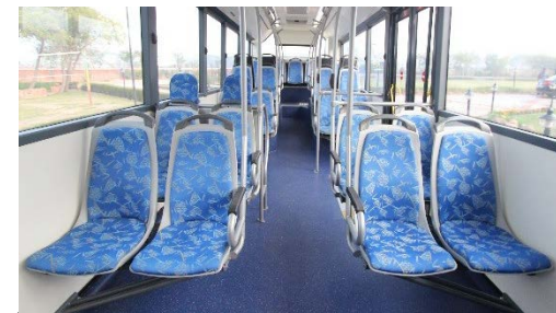
Low Floor AC Bus

c Passenger Information System (PIS) LED displays and automatic announcement systems, which provides the passengers web based real time expected time of arrival/ departure