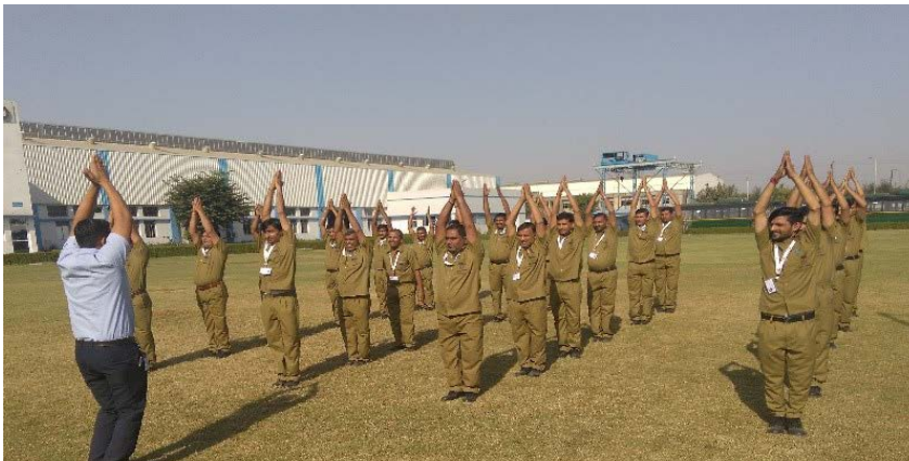
Training of Crew

A flying squad is for emergency help with hampering the operation of buses.