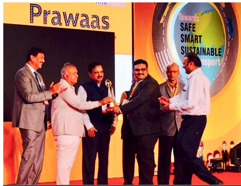
Award presented by Shri Ramalinga Reddy (Transport Minister of Karnataka) and Shri Diwakar Raote (Transport Minister of Maharashtra)

Received Award for Best Innovative Project by Bus Owners Confederation of India (BOCI)