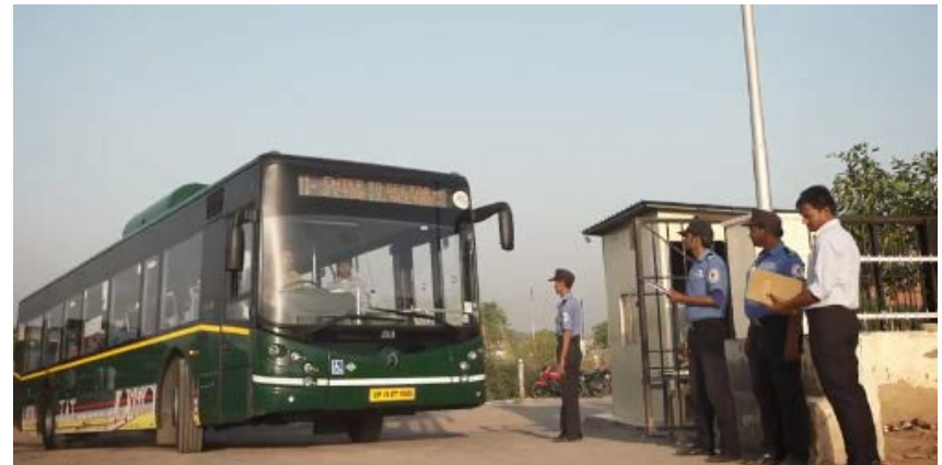
Daily Inspection of Buses