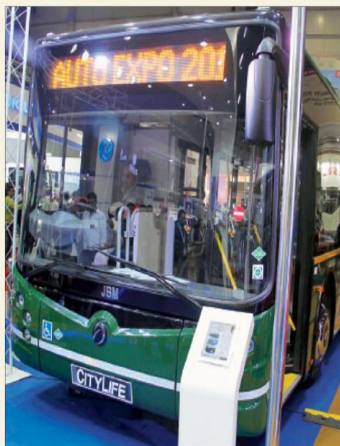
ये बसें ऑटो एक्सपो में हैं। इन्हें नोएडा-ग्रेटर नोएडा में चलाया जाएगा