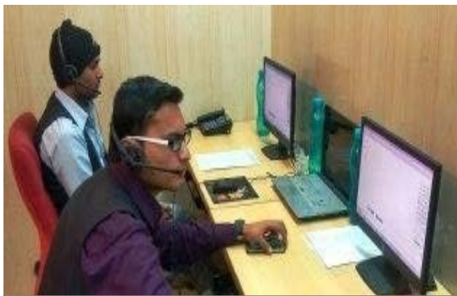
"Control Room" of City Bus Service

City Bus Service has a facility of Lost and Found Cell