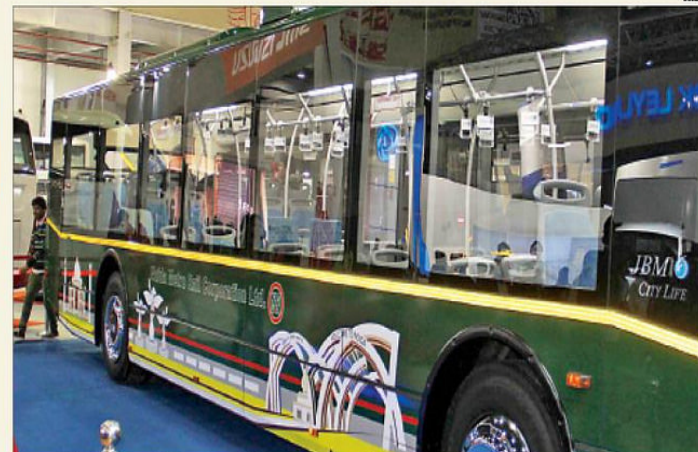
कई मॉडर्न सुविधाएँ हैं इस बस में जिनकी बदौलत सिटी बसों का सफर शानदार और जानदार होगा

नीलिंग फेसिलिटी : कंपनी के अधिकारियों ने बताया इस फेसिलिटी के कारण बस 6 सेंटीमीटर तक झुक सकती है। इससे बस स्टॉप पर खड़े पैसंजर को बस में चढ़ने में आसानी होगी।